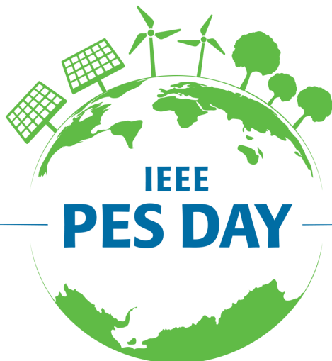
Mariana Lecor - UTEC

https://r9.ieee.org/uruguay-ims-pes/2024/03/21/concurso-de-videos-cortos-sobre-movilidad-electrica-pes-day-2024/