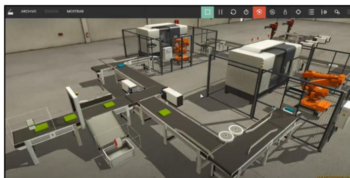
Ilustración 2- Proyecto de automatización desarrollado con Factory I/O